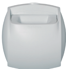
Bap'SI simple débit sanitaire

La bouche BAP'SI Simple Débit Sanitaire, idéale pour les logements neufs, elle permet de garantir un débit d'air constant quelles que soient les conditions dans le logement.