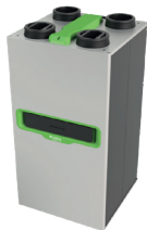
InspirAIR® Top 300 Classic

La solution double flux qui filtre efficacement les polluants les plus fins et s'adapte à vos besoins