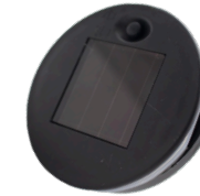
Bouton ON/OFF Button on / off