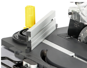
Guide d'angle Angle guide