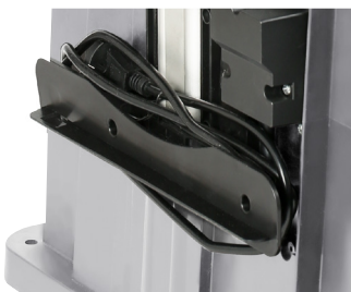
Enrouleur de câble Cable storage

Livrée avec guide parallèle, guide d'angle, poussoir et clef de serrage Delivered with parallel guide, angle guide, pushing bar and tightening wrench