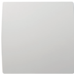
GRAPHIC vue de face