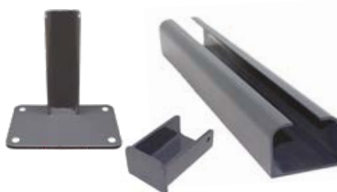
POTEAU DÉPART/FIN - CAPOT - PLATINE