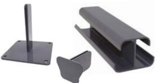
POTEAU MULTIFONCTION - CAPOT - PLATINE