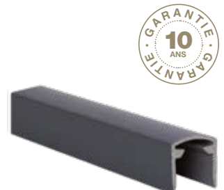
PROFIL DE FINITION