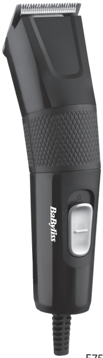
E756E - T156a

Efter rengøring tændes der for apparatet og skærene smøres med olie ved at dryppe få dråber af den medføl-gende olie over skærene. Anvend kun smørolien, der følger med dette produkt, da den er specielt formuleret til højhastighedsklippere og ikke fordampner eller gør skærene sløve.