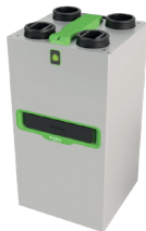
InspirAIR® Top 300 Premium ERV

La solution double flux qui filtre efficacement les polluants les plus fins et s'adapte à vos besoins