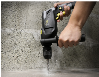
Fonction percussion Impact function

Livrée en boîte couleur Delivered in color box