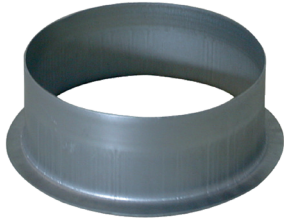
Piquage Equerre sur Plat 90°

Le piquage équerre sur plat permet de réaliser un piquage à 90° sur un conduit de type oblong ou rectangulaire galvanisé.