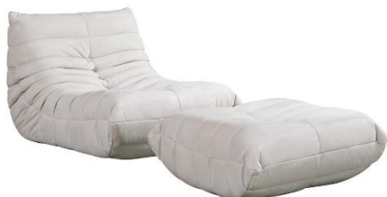
Relaxsessel CHILL Beige