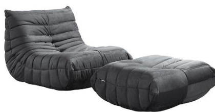
Relaxsessel CHILL Anthrazit