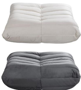
Relaxsessel Hocker CHILL