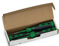
Kit d'outils de manipulation (carton)